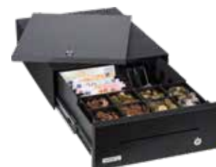
Insert du tiroir rempli