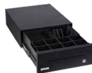
Insert du tiroir vide

Serrure à cylindre à 3 positions (ouverture d'urgence, utilisation électrique, verrouillage), 2 clés incluses avec 150 variantes de fermeture en option.