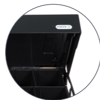
Innenkassette mit Deckel