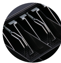
Scheinniederhalter aus Metall