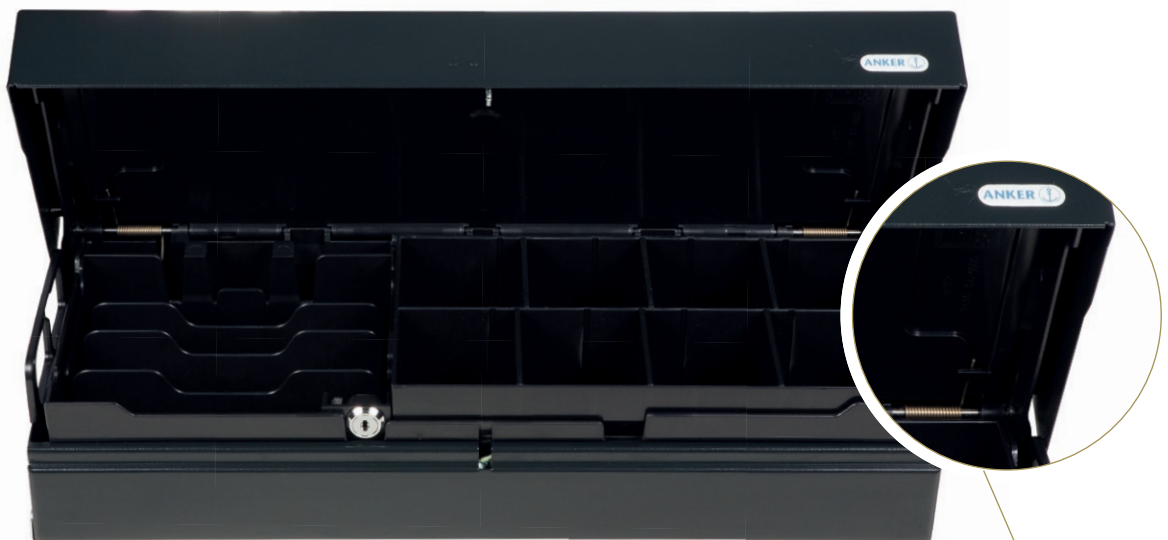
Innenkassette mit Deckel

› Servicefreundlich durch abnehmbares Kabel