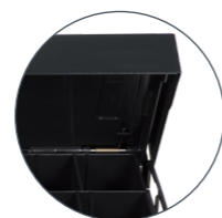
Innenkassette mit Deckel