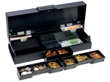
Bestückte Kassette mit Einsätzen

Das Design der etablierten SCC wurde beibehalten. Der Münzeinsatz lässt sich komplett entnehmen. Coin Cups aus der vorherigen SCC Version können einwandfrei weiter verwendet werden.