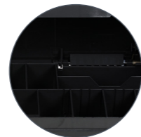
Kassette mit 9 Münzfächern