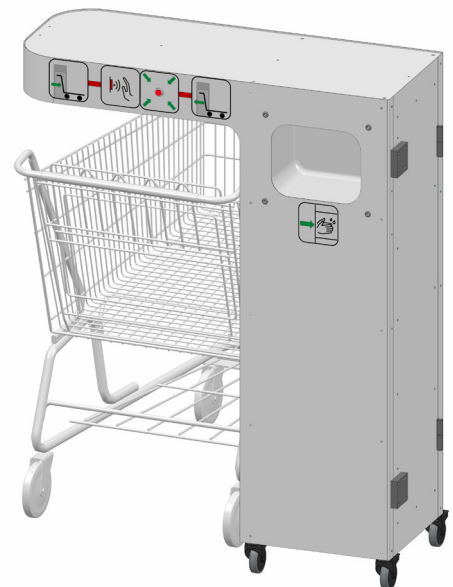
Mobile Desinfektionsstation TEKA desinfecto Spray ECO für Einkaufs- und Gepäckwagen