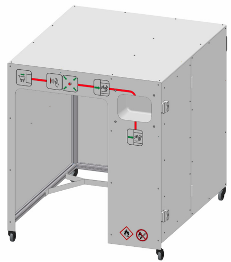
TEKA desinfecto Spray PRO