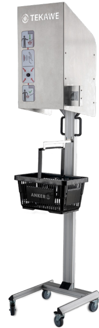
Mobile Desinfektionsstation TEKA desinfecto Spray BASKET für Einkaufskörbe