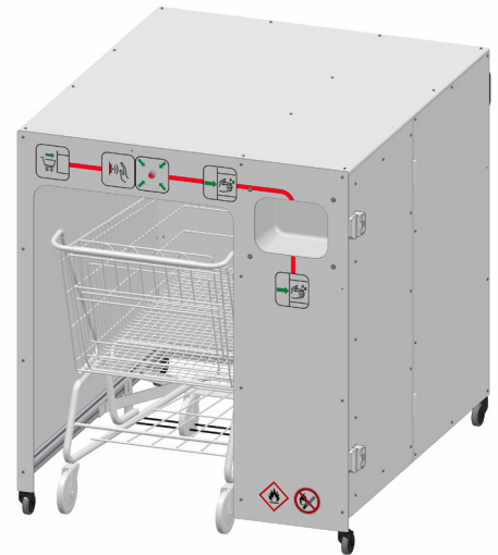
Mobile Desinfektionsstation TEKA desinfecto Spray ECO für Einkaufswagen