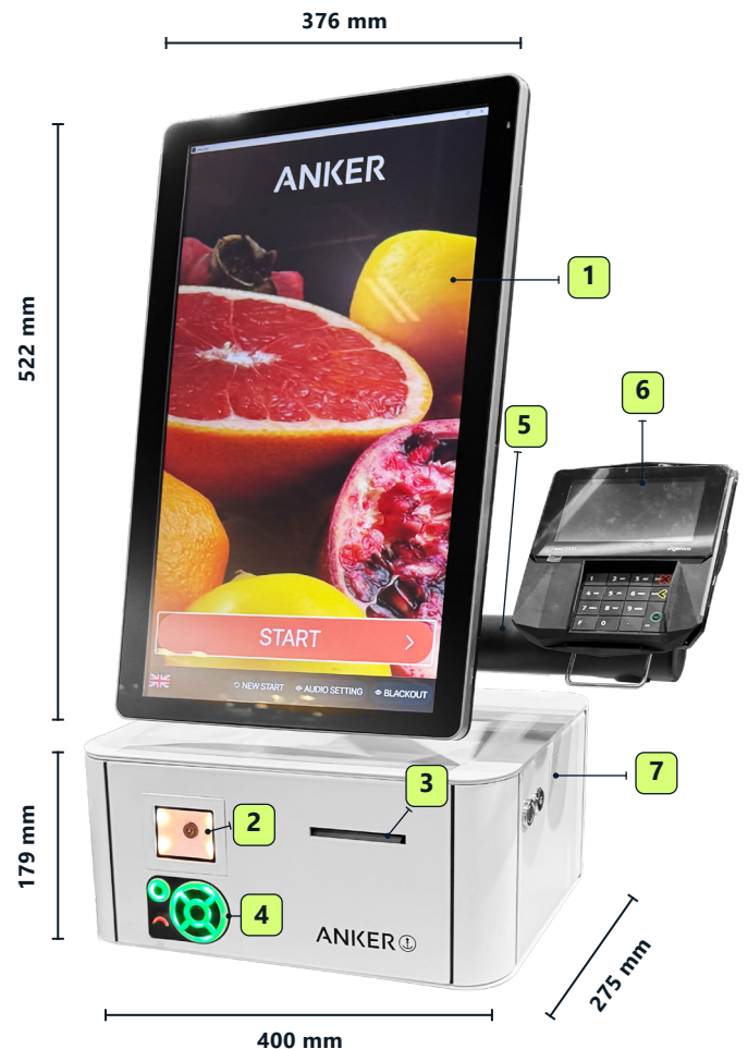
Ausführung mit Touch POS Terminal Audrey A7-AL

**Zahlungsterminal/EAA-Pad®/ADA-Pad® nicht im Lieferumfang enthalten