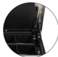
Innenkassette aus Metall